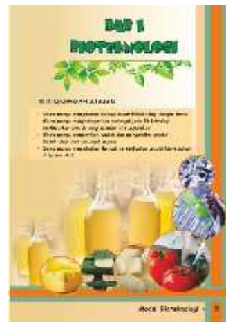
Gambar 7. Muka Bab I Setelah Revisi

Berdasarkan gambar diatas, maka terdapat perbaikan pada tujuan pembelajaran siswa menjadi lebih detail dan sesuai dengan formula ABCD yakni Audience, Behaviour, Conditioning dan Degree (Ningrum, 2015).