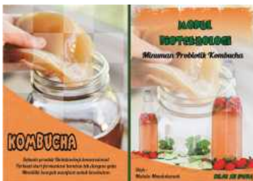
Gambar 1. Sampul Sebelum Refisi