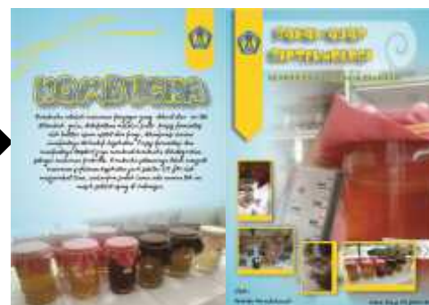
Gambar 2.. Sampul Setelah Refisi

Berdasarkan gambar diatas menunjukkan bagian yang mendapatkan refisi/perbaikan pada bahan ajar oleh validator 1. Pada poin pertama susunan kata semula adalah penyusunan modul kemudian mendapatkan refisi dengan refisi penyusunan bahan ajar.