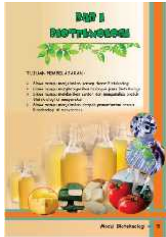
Gambar 6. Muka Bab I Sebelum Revisi