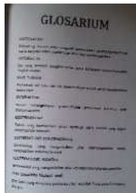
Gambar 5. Penambahan Glosarium Setelah Refisi

Berdasarkan gambar diatas pada halaman akhir bahan ajar terdapat penambahan glosarium, sehingga memudahkan siswa dalam mencari pengertian dari kata-kata asing pada bahan ajar.